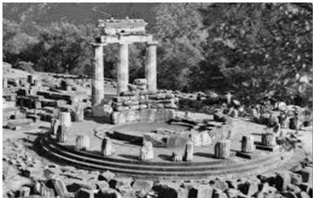
Teatro de Apolo en Delfos

“En el Parnaso se adoraba a Apolo, dios de la verdad y de la luz, y desde todas partes del mundo helénico acudían las gentes a su templo para pedirle consejos y protección, preguntaban si la cosecha del año sería buena o mala, si debían comprar un esclavo, si casarse o no.